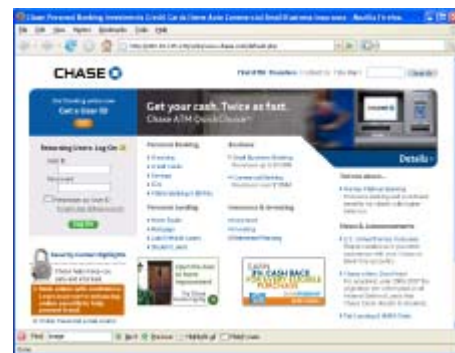
图2：如果您点击了链接，您将被带到一个看上去和Chase bank相似的网站。事实上，这是一个由犯罪者架设的伪造网站。该网站用来盗取您的银行帐号和密码。

图1在这封邮件似乎由Chase bank发出，要求您点击这个链接来升级您的账户信息。实际上，这就是一次社会工程学攻击，这并不是来自Chase bank的邮件，却是一封来自犯罪者的伪装成我们所信任的Chase bank的邮件。